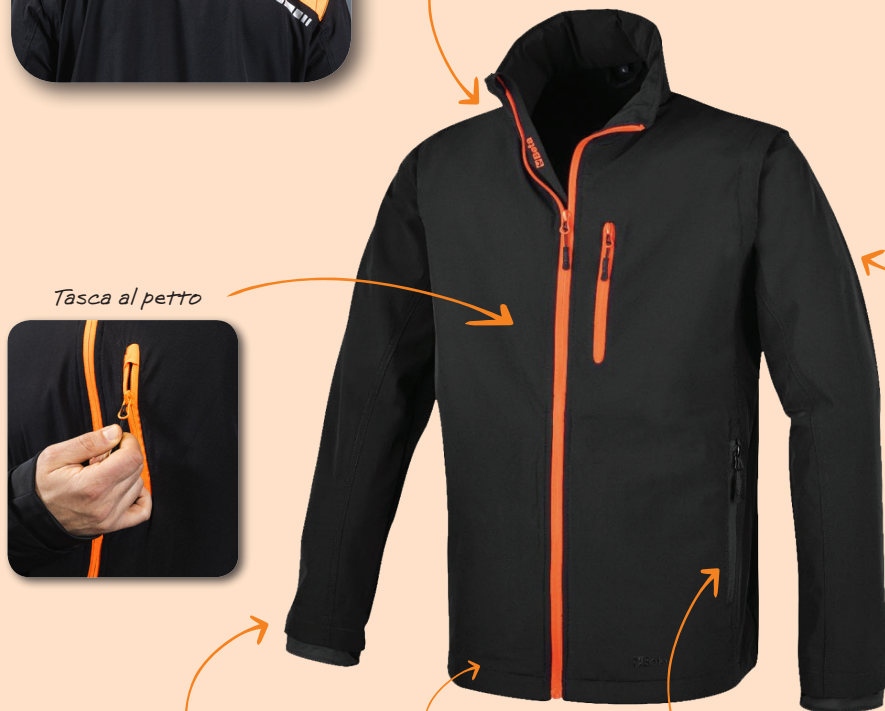
Tasca al petto