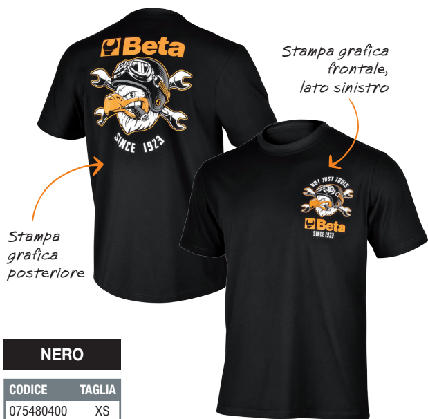
Stampa grafica posteriore