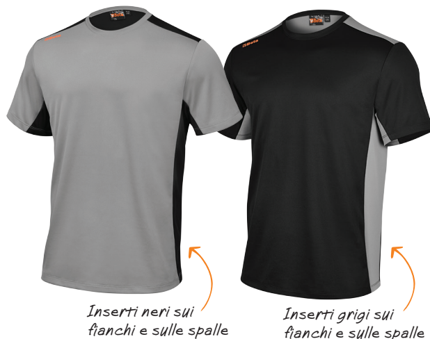
Inserti neri sui fianchi e sulle spalle