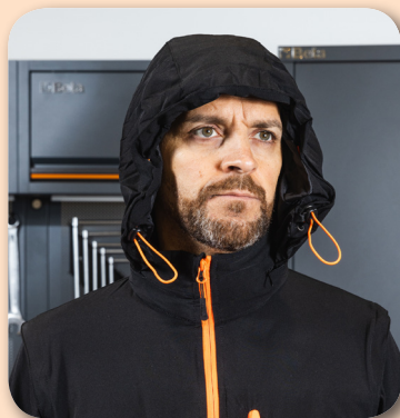
Cappuccio a scomparsa con regolatori a coulisse